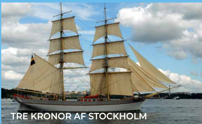
TRE KRONOR AF STOCKHOLM